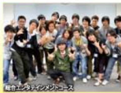
総合エンタテインメントコース

今回は生徒の質問に一つ一つ質問を考慮して頂き、一問一答形式で質疑(?)を行わせて頂きました。質疑のタイムになるかどうかは...まだ不明ですが(苦笑)、とにかく全力投球で答えていきますよ!