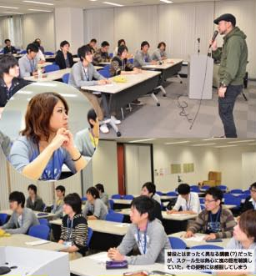
普段とはまったく異なる講義(?)だったが、スクール生活熱心に嵐の話を聴いていた。その授業には感動してしまっ