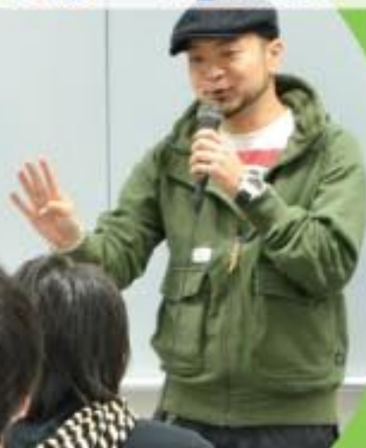
パチンコ・パチスロ業界特化型の専門学校「G&Eビジネススクール」にて、必勝本ライター嵐が、ひょんなことから教壇へ立つことに。本当にいいんですか?!